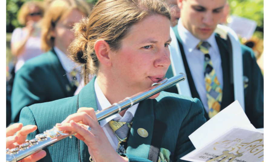
Starke Leistung der Musikgesellschaft Melchnau: 89,3 Punkte.