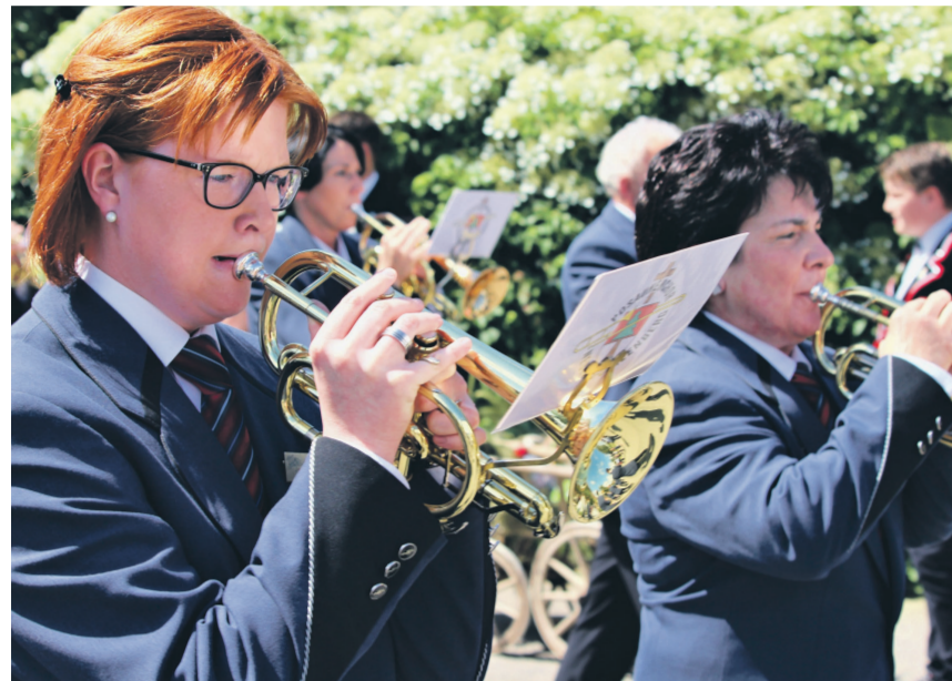
Der Posauenchor Ochlenberg ist sehr gut unterwegs: 91,3 Punkte.