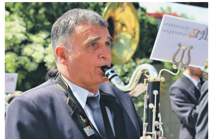
Mit der Bassklarinetten auf dem Marsch – dies braucht Kraft und Geschick.