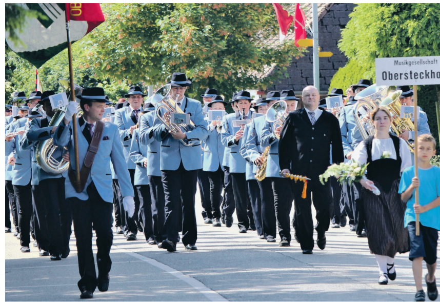
Die Musikgesellschaft Obersteckholz geht als erste auf die Marschmusikstrecke.