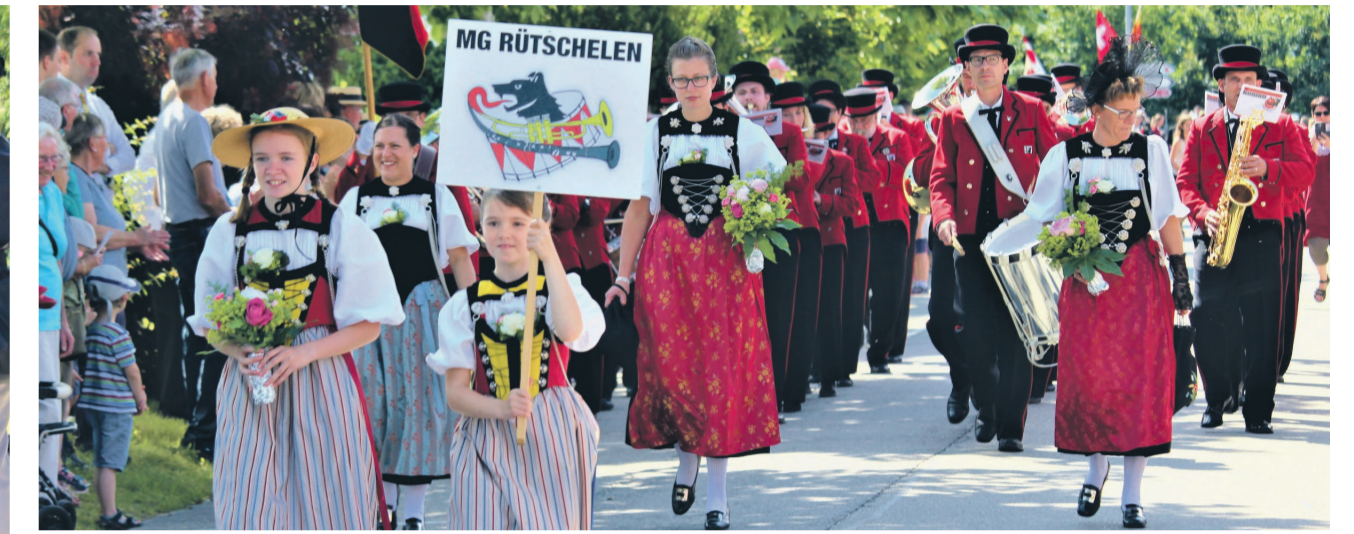
Die Musikgesellschaft Rüttschelen auf der Parade mit einem eindrücklichen Auftritt.