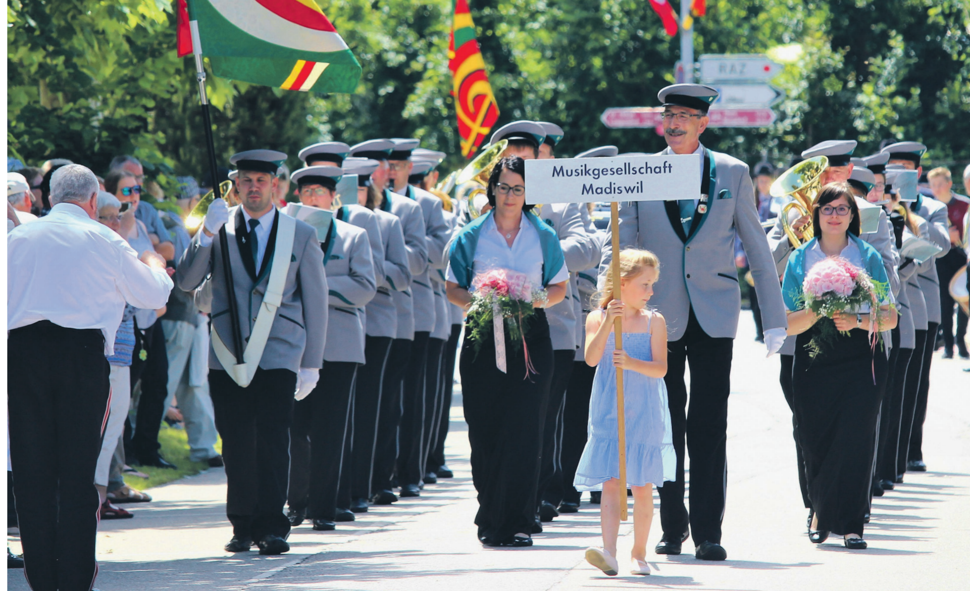
Der Marsch der Musikgesellschaft Madiswil kommt beim Publikum gut an.