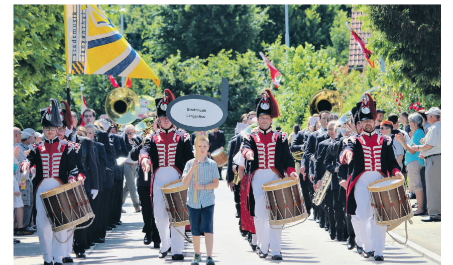
«Vorwärts Marsch» für die Stadtmusik Langenthal.