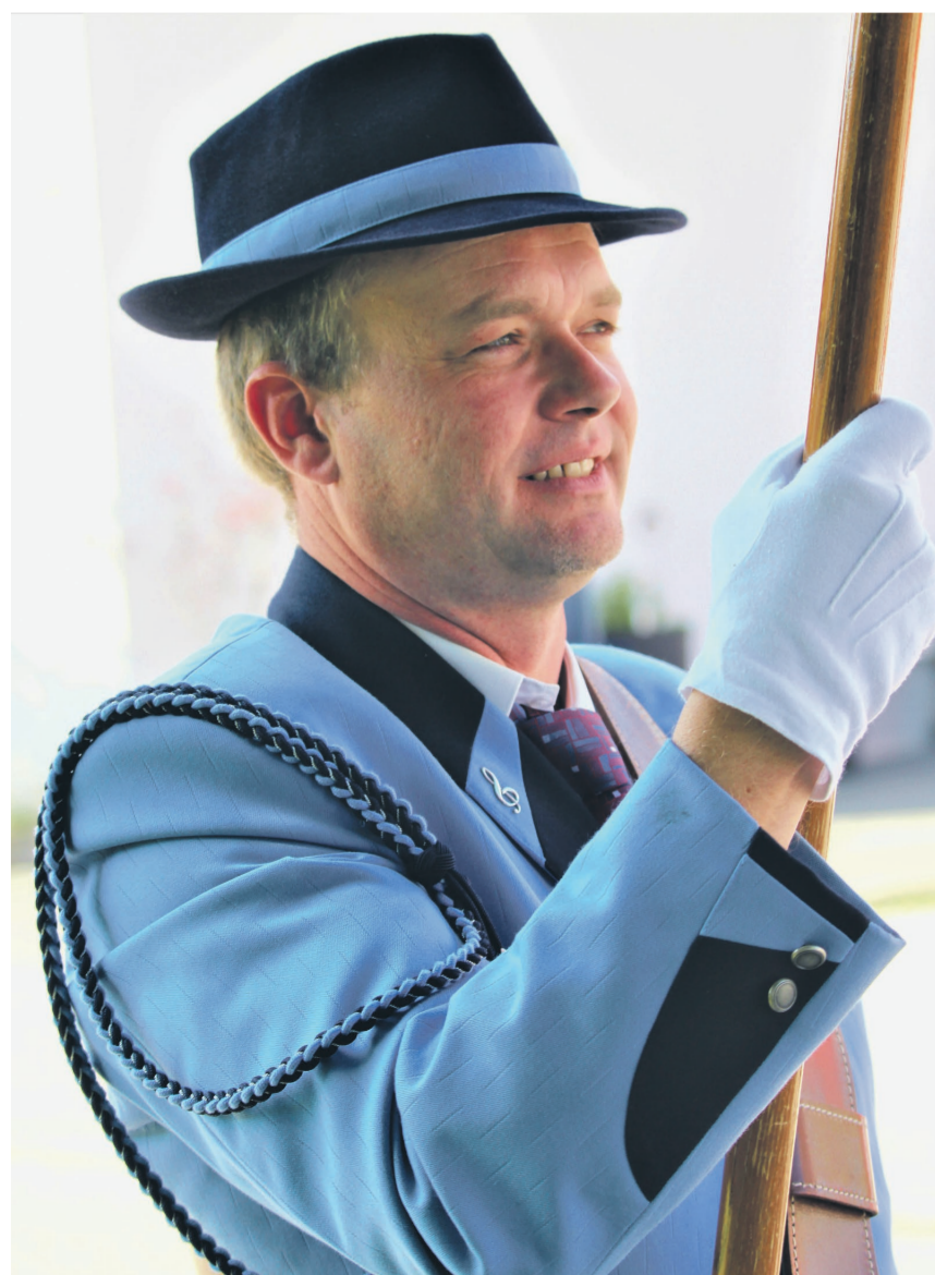
Die gute Laune des Fähnrichs steckt an.