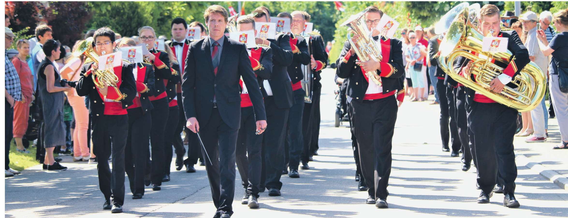
Mit ihrem hervorragenden Auftritt an der Marschmusikparade siegte die Oberaargauer Brass Band mit Abstand und eindrücklichen 95 von 100 Punkten.

Weil eine Jury die Darbietungen der 25 Musikgesellschaften bewertete, bot der Oberaargauische Musiktag 2018 in Herzogenbuchsee neben harmonischen Klängen und Geselligkeit auch Spannung. 25 oberaargauische Musikcorps boten beste Unterhaltung. Grosser Publikumsmagnet waren einmal mehr die Marschmusikparaden. Mit ihrer strammen Parade sorgte die Oberaargauer Brass Band für ein absolutes Highlight und siegte mit 95 von 100 möglichen Punkten deutlich.