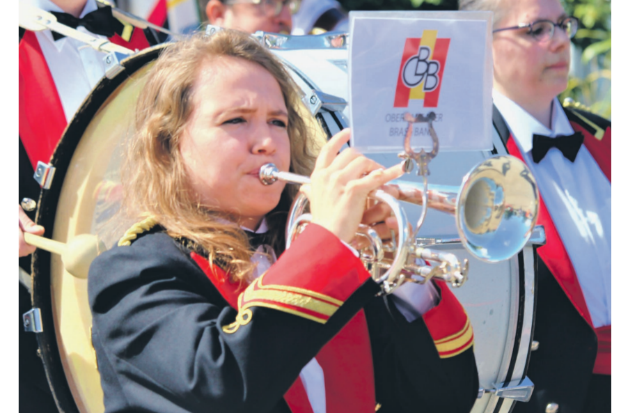
Die Oberaargauer Brass Band beeindruckt die drei Jurymitglieder.