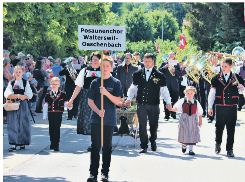
Toller Auftritt des Posauenchors Walterswil-Oeschenbach: 88,7 Punkte.